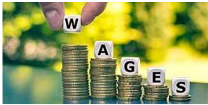
SOARING COSTS. With growing inflation due to the West Asia crisis, the cost of living has spiralled

The valuation of essential commodities (such as food or housing) supplied at concess-