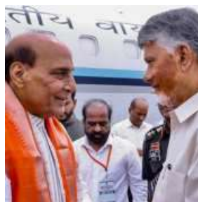
Defence Minister Rajnath Singh was received by Andhra Pradesh Chief Minister N Chandrababu Naidu at the Puttaparthi Airport in Sri Sathya Sai district on Friday

Aatmanirbharta in defence manufacturing was a critical imperative to safeguard national interests in the current era of global turbulence, Singh said, adding, “These projects will cater to all the branches of the defence forces. This strategic diversi-