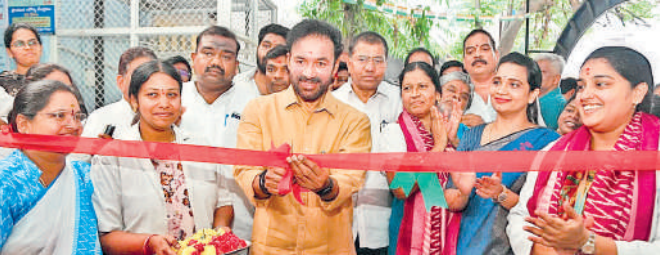
బాగ్ అంబర్ పేట్లో రిజిస్ట్రేషన్ కలెక్షన్ వైద్య పరికరాల కేంద్రాన్ని ప్రారంభిస్తున్న కేంద్రమంత్రి జీ కిషన్ రెడ్డి